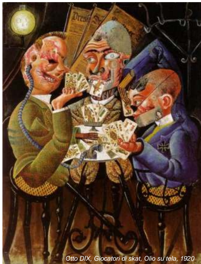
Otto DIX, Giocatori di skat, Olio su tela, 1920

SABATO 4 MARZO 2017 PRESSO IL MONASTERO DEL MARANGO CAORLE (VE)